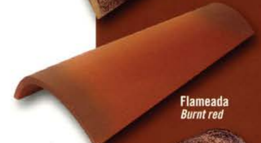
Flameada Burnt red