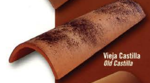
Vieja Castilla Old Castilla