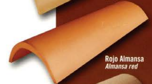
Rojo Almansa Almansa red