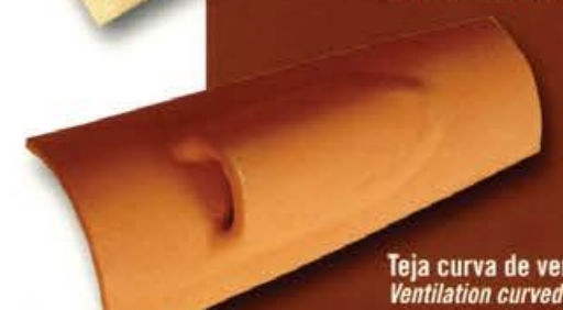
Teja curva de ventilación Ventilation curved roof tile